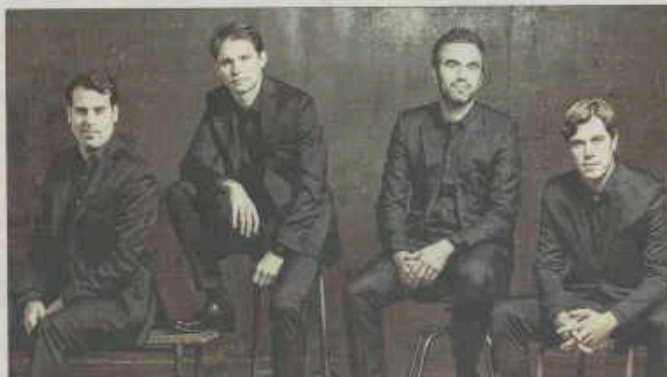
Le Quatuor Modigliani, formé en 2003, a déjà enregistré une dizaine d'albums.

Dotées d'un cadre magnifique, les Nuits du Mont Rome ont accueilli depuis leur création des grands noms de la musique classique, tels que Frédéric Lodéon, Gautier Capuçon ou Bertrand Chamayou. À l'occasion de cet anniversaire, la fête se devait d'être brillante. Et ce sera le cas.