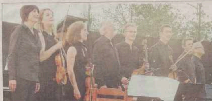
Le groupe Galitzin, émule des Conservatoires nationaux supérieurs de musique de Paris et de Lyon, a clôturé ce 20 e festival des Nuits du mont Rome.