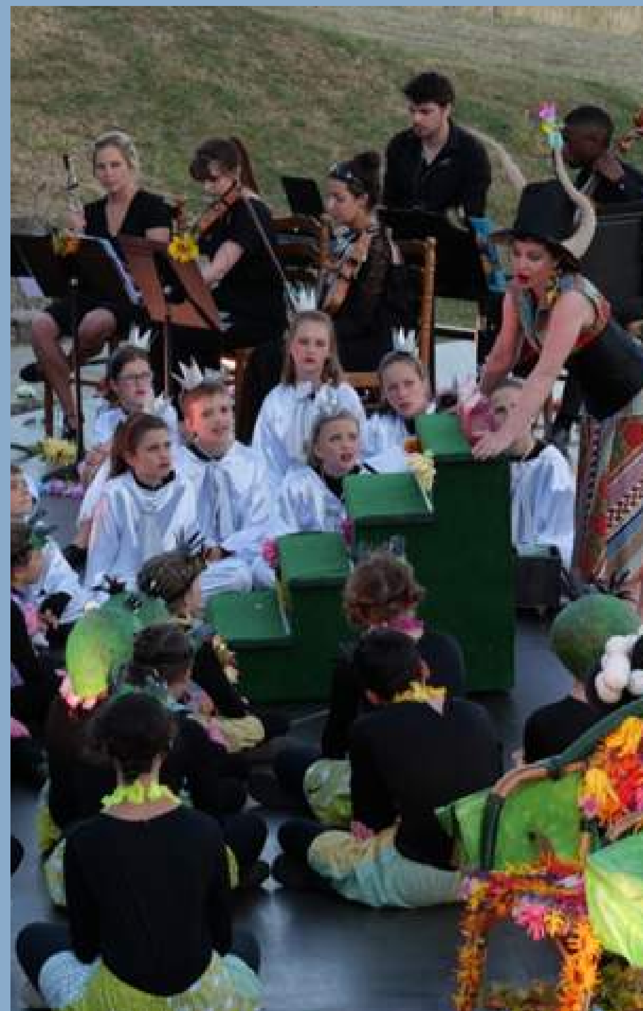
Chœur des Nuits du Mont Rome 2019